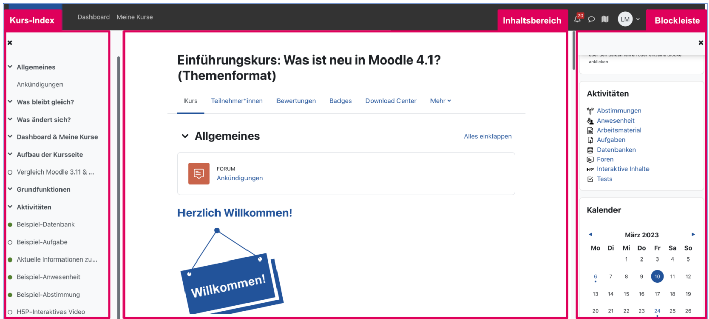
Abb. 2: Dreiteilung eines Lernraums in RWTHmoodle