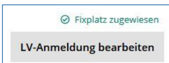
Abb. 1: Anzeige der Fixplatzzusage in RWTHonline

Informationen zur automatischen Buchung von „Studierenden“